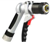
NOZZLE EXAMPLE MODEL LPG 800 IGSB